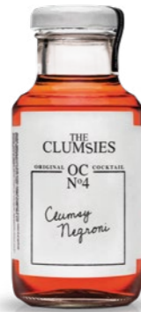
Nº4 Clumsy Negroni The Clumsies Old Tom Gin, Sweet Vermouth, Bitter, Lemon Pepper, Long Pepper