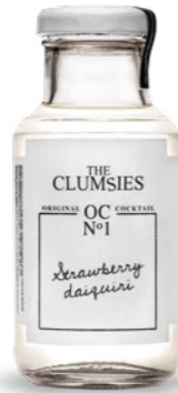
Nº1 Strawberry Daiquiri Rum, Strawberry, Vanilla

Το The Clumsies, που βρίσκεται για τέταρτη συνεχόμενη χρονιά στην πρώτη δεκάδα της απαιτητικής λίστας The World's 50 Best Bars, πρωτοτυπεί και εμφανίζει ειδικά για το Ageras beach bar, τα best-selling cocktails του.