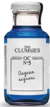
Nº5 Aegean Negroni The Clumsies Old Tom Gin, Pikron Vermouth, Aperitivo amaro, rhubarb, bourbon apepper, long pepper, apple geranium