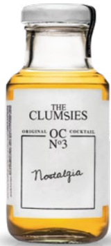
Nº3 Nostalgia Aged rum, Biscuit, Hazelnut, Bitters